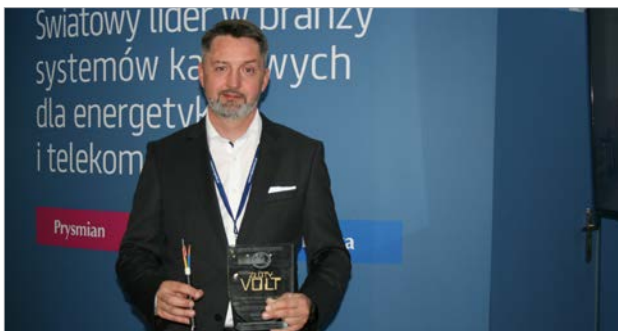
Statuetka „Złoty Volt” Polskiej Izby Gospodarczej Elektrotechniki trafiła do firmy Prysmian Group