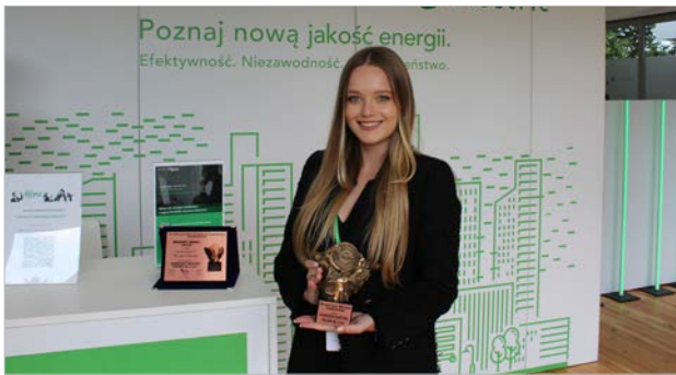
Medal Brązowy za produkt EcoStruxure Microgrid Advisor otrzymała firma SCHNEIDER ELECTRIC POLSKA Sp. z o.o.