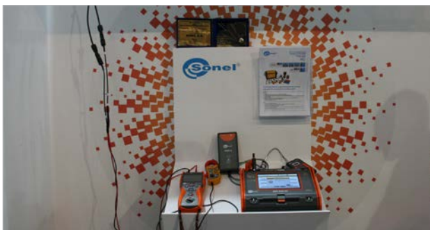
Laureatem Medalu Prezesa SEP w 2021 r. została firma SONEl S.A.