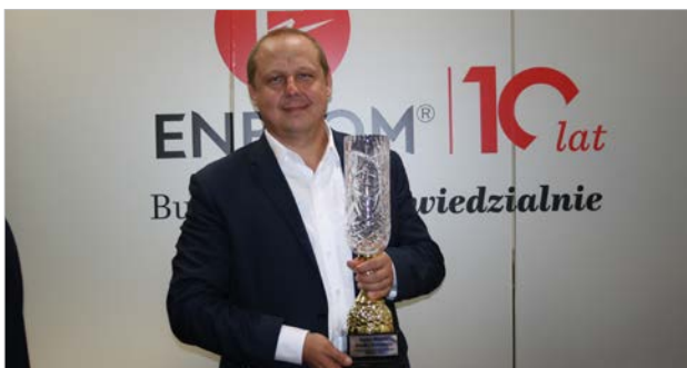
Firma ENPROM Sp. z o.o. odebrała w tym roku dwie nagrody: Złoty Medal Polskich Sieci Elektroenergetycznych S.A. i Puchar Ministra Klimatu i Środowiska